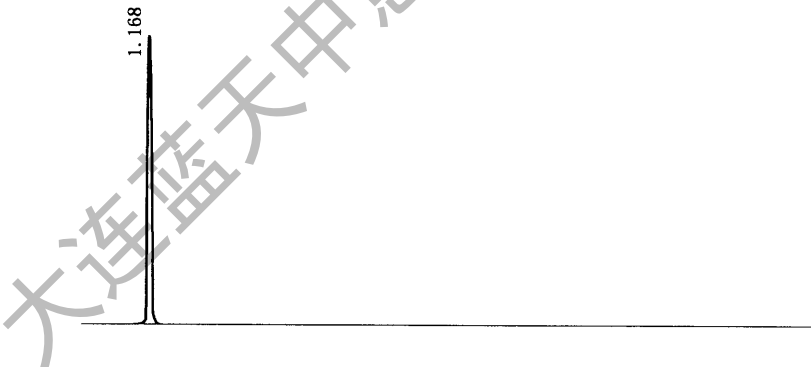
图 1 氢气组分典型色谱图

允许根据实际情况适当调整变动。所选择的色谱工作条件应保证试样中的各组分都能被有效分离。凡能达到同等或更高分离效果的其他色谱工作条件均可使用。 各组分的出峰顺序见图 1~图 3。